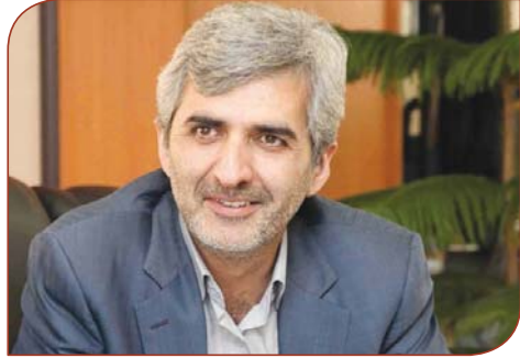
بازگشایی می شود به فکر تغییر شکل خودنمودند.