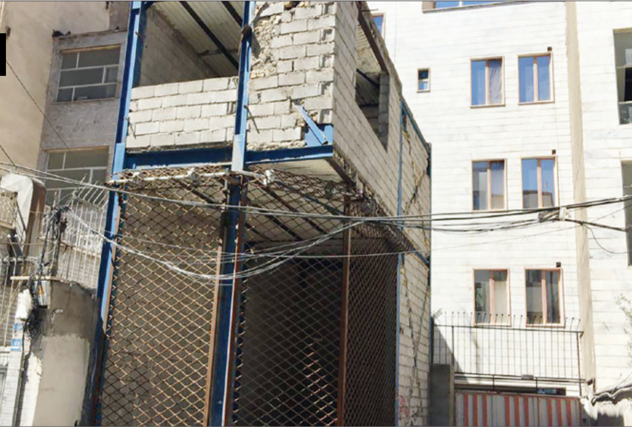
گزارش «طهران شهر» از محله قدیمی «ارمنه»