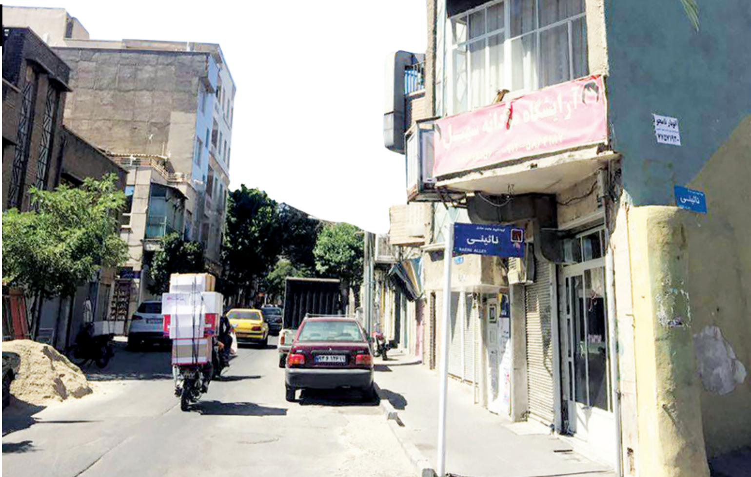
«طهران شهر» از مشکلات و چالش های محله «سبلان» گزارش می دهد: