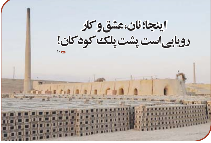
عابدین سلالی اسکر