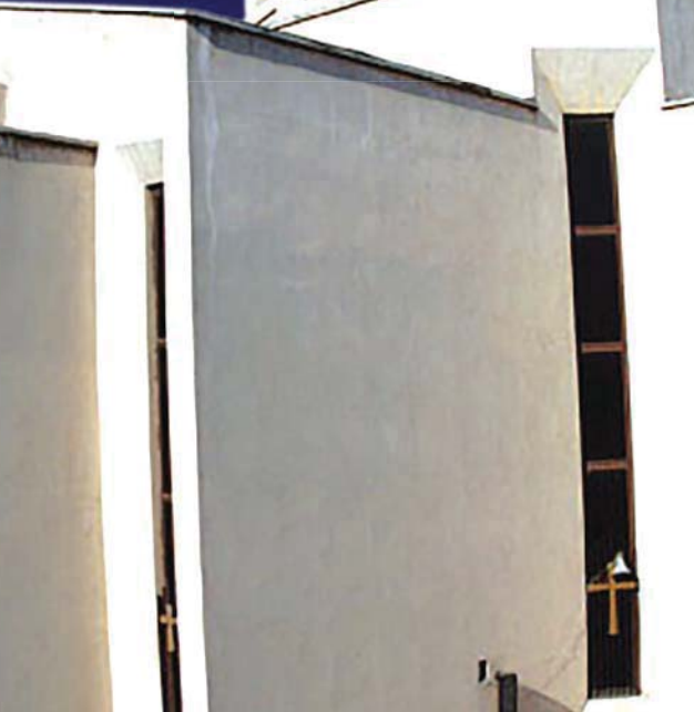
در نشست شورایاری این محله مجیدیه تهران مطرح شد.