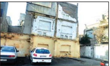
سرایی دور از دسترس اهالی محله

وی به وجود دکلهای مخابراتی در محله اشاره کرد و افزود: در مورد دکلهای مخابراتی، اصلا خود شورایی شهر مصوبه دارد که این ها نباید در منطقه ای که بیمارستانی و آموزشی است، نصب شوند. جای باید باشند که مشکل ساز نشود، ولی متأسفانه سه تا دکلهای محله امامزاده عبدالله وجود دارد که هر سه تا را گذاشتند در جاهای حساس، یکی جنب در مانگاه که جای یک جنب مدرسه است ایناژ جدید، روبروی مدرسه مفتوح که من خودم در سال ۹۳ استشهادهم جلوی آن را بردم و حتی پرونده آن رفته در ماده ۱۰ که آن طرف رابطه و آشنا داشت، حالا چه علتی پرونده را برگرداند و گفتند آن پرونده که گرفته آنجا به خاطر تخلفات ساختمانی آن رفته بوده است. الان بعضی روزها وقت خودم، رنگ و ورزش بچها به مدرسه مفتوح می روم، تا ساعت ۱۱ آنجا هستم، تمام بچها، به هر کسی می گویم ورزش کنید، همه آن ها می گویند ما سر در و سر گیجه داریم!