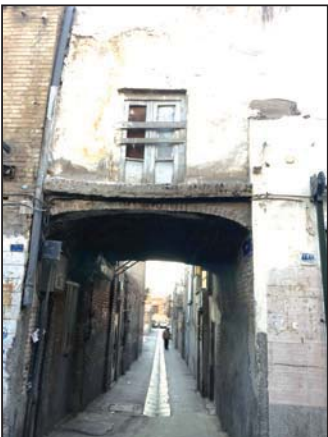
خدمات رایگان به اهالی محله

مشکلات محله بر می گردد به بافت فرسوده، متأسفانه از سال ۱۳۸۴ به این محله اجازه ساخت ندادند. یعنی از نفاذ آن شد روی ۷/۵ متر، نه کسی دیگری آمد در این محله مشاغل کت و سوسه گذاری کند. نه برای اهالی محله به صرفه است که مسازند یا این مصالح گران و دستمزد دهد. دیگر به همین صورت مانده است! اگر یک خانه اینجا آتش بگیرد، اکثر کوچه های اینجا کوچه های آشتی کتان است! یک عده ماشین آتش نشانی می خواهند بیایند اینجا به زوری می آید. باید ۱۵۰۰ متر شیلنگ بکشد!