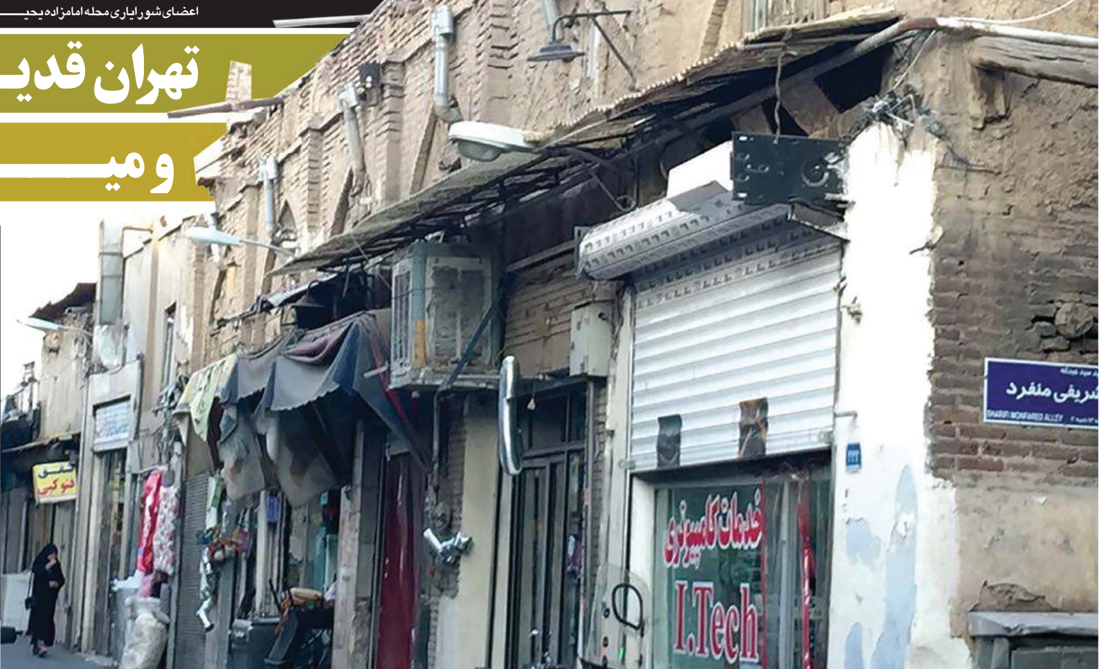
اعضای شوراییارای محله امامزاده یحیی

امامزاده یحیی یکی از قدیمی ترین محلات مرکز شهر تهران است. بخشی از هویت این محله وابسته به وجود امامزاده یحیی در این محله است. بخش غربی محله به تدریج در حال تغییر کاربری به تجاری است. شهر داری در بخش های غربی آن مجوز پاساژهای تجاری را داده است که در نوع خود عجیب و غریب است. چرا که معابر منتهی به آنها بسیار تنگ و باریک است و کمترین دسترسی را دارد. تا چه برسد به وجود پارکینگ. بقیه بخش های محله نیز به قول یکی از شوراییاران تپه های ارزشمند خاک است که با یک فوت فرو می ریزند. این محله توسط سه ضلع: بزمان، میراث فرهنگی و شهرداری به گروگان گرفته شده است. سرانه های خدماتی آن بسیار ناچیز است. باینکه آن چند نقطه میراثی توسط شهرداری بازسازی شده است. اما عملاً گردشگری به دلیل ترافیک و ساختار کالبدی آن، به آنجا نمی رود. چیزی فقر نیز در این محله محروم و عربان می باشد. قیمت ملک در این محله با محله های نزدیک به آن قابل مقایسه نیست. در ادامه محله گردی هفتگی به محله امامزاده یحیی در منطقه ۱۲ آمدیم. ابتدا در جمع شوراییاران و سپس مردم خوشگرم آن حاضر شدیم. نتیجه ی این تالیش در زیر تقدیم می شود: