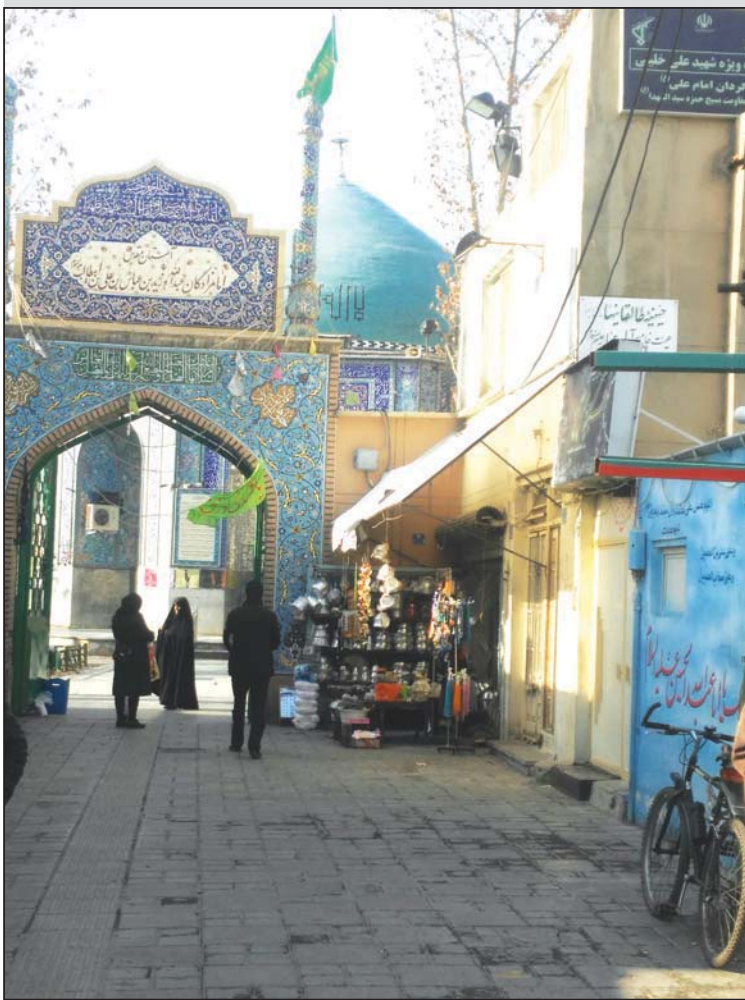
آسیب شناسی محرومیت عریان محله قدیمی «امامزاده عبدالله»