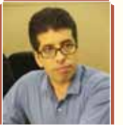
عابدین سالاری اسکر سرمقار

ادعای شهرداری تهران این است که امروز محله هرندی نسبت به دیروز محله بهتری برای زندگی است و آنچه را که زندگی عادی شهروندان این محله را دچار چالش کرده بود، از میان رفته است.