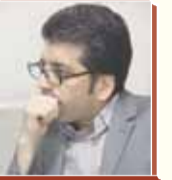
عابدین ساراری اسکریپتور

روز یکشنبه هفته قبل در خبر آمد که «مجموعه نمایشگاهی شهر آفتاب به صورت کامل و ۶۰ درصد سهام فروشگاه شروند به بانک شهر واگذار شد»