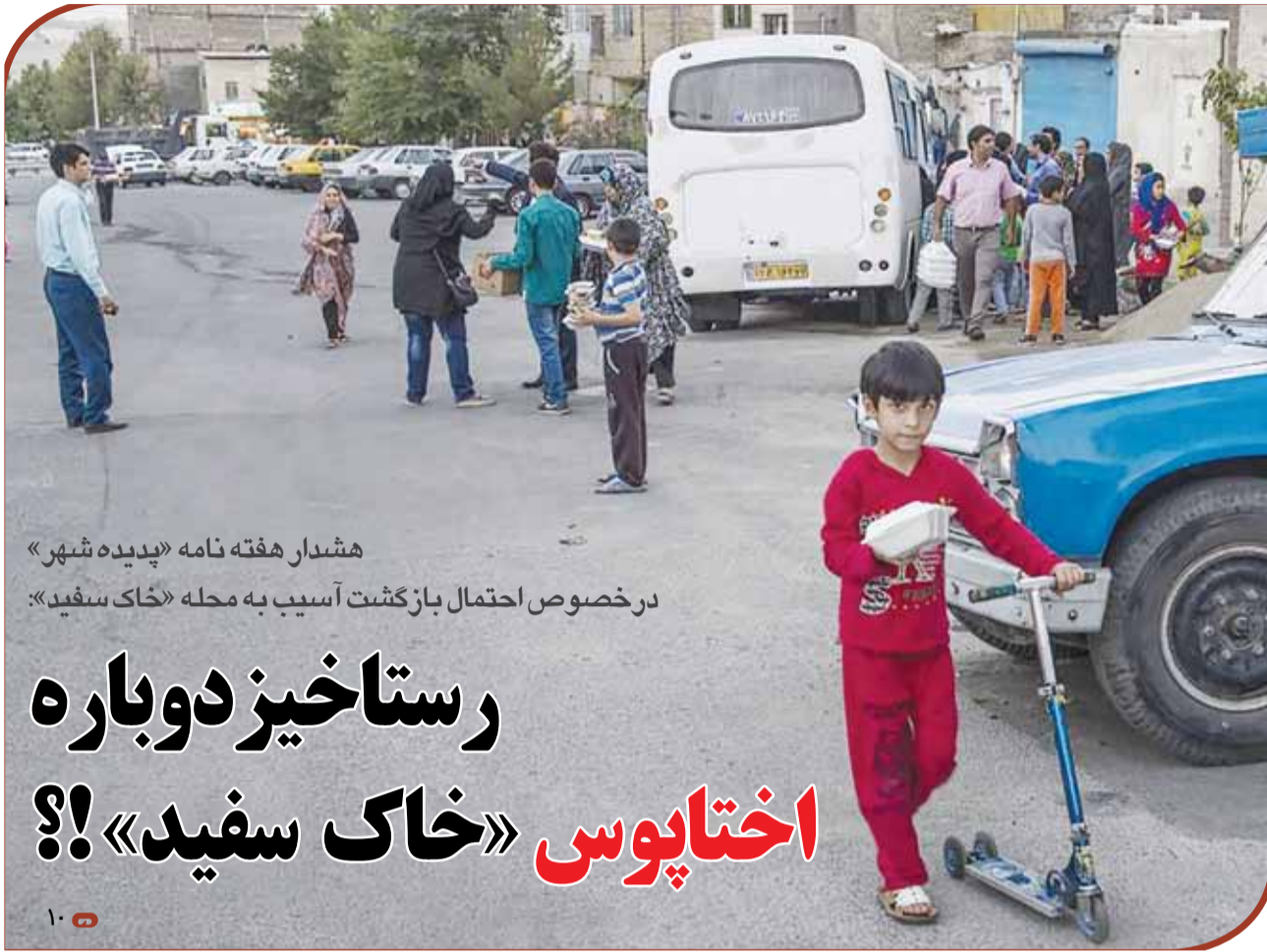
هشدار هفته نامه «پدیده شهر» در خصوص احتمال بازگشت آسیب به محله «خاک سفید»:

اما سوال اساسی در این میان این است چرا این تنش ها و جدل ها گاه شکل غیر متعارف و غیر قابل قبول پیدا کرده است؟ داد زدن با صدای بلند، به کار بردن الفاظ خاص تناسبی با نمایندگی مردم با فرهنگ تهران و الزامات رفتار مدنی و پارلمانی ندارد. به نظر می رسد عقلای شورا باید برخی از اعضا را در این خصوص توجیه نمایند که منازعه، اختلاف نظر، چالش و حتی تضاد راه حل های مدنی و قابل قبول تری برای حل و فصل می تواند داشته باشد و تکرار این رفتار باعث و هنر شورا می شود!