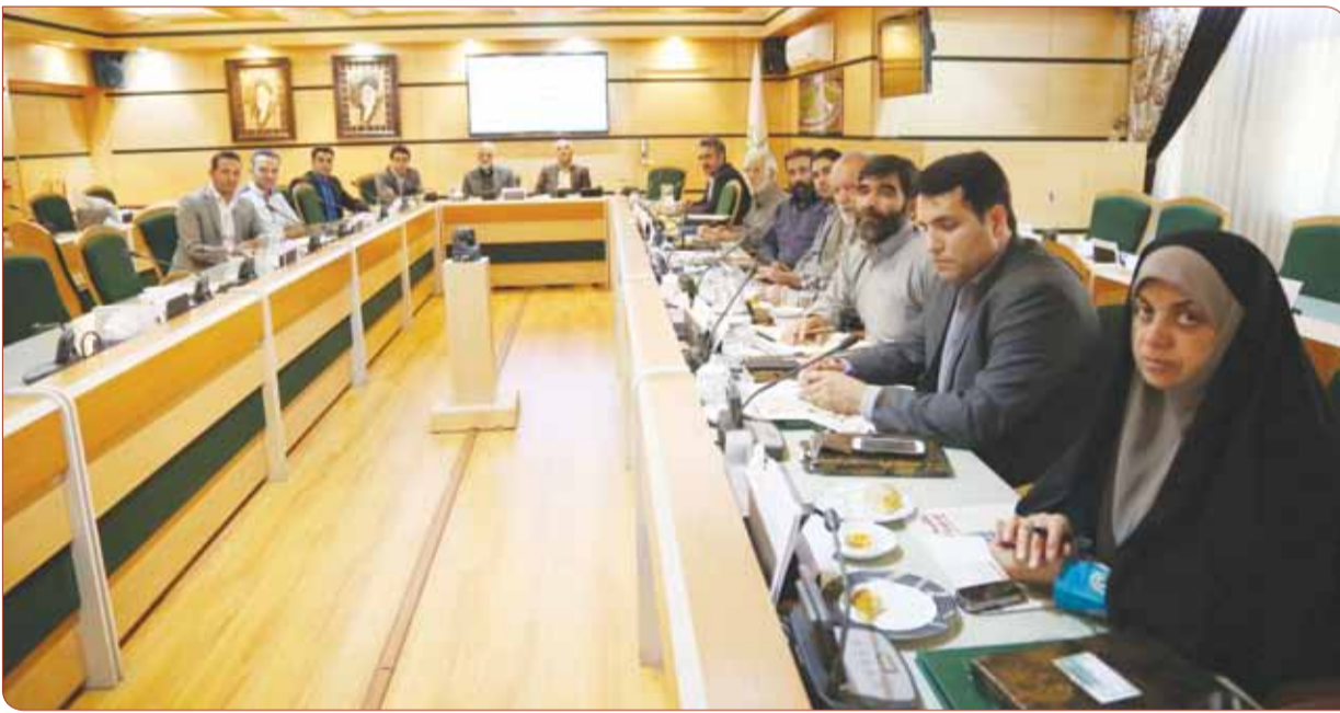
در نشست هم اندیشی دبیران شوراییاری منطقه چهار با «پدیده شهر» مطرح شد: