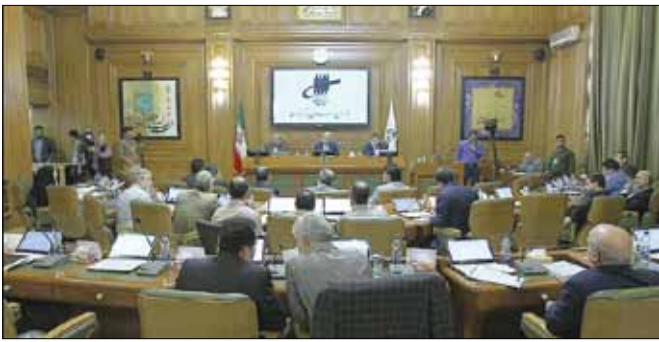
«پدیده شهر» کارنامه اصولگر ایان شورا را بررسی می‌کند: